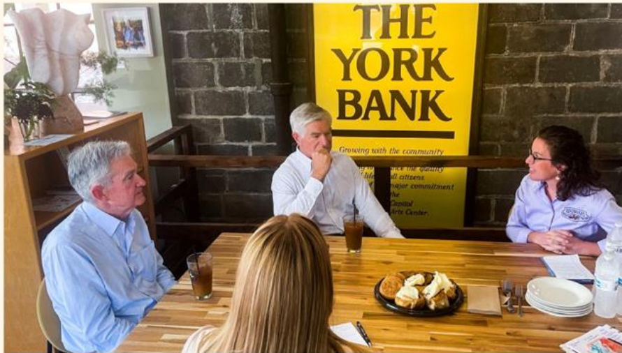
Federal Reserve-voorzitter Jerome Powell (uiterst links op de foto) kreeg maandag op bezoek bij kmo's in York County, Pennsylvania de oren uitgewassen over de hoge inflatie en erg krappe arbeidsmarkt

Beleggers gaan er steeds meer van uit dat Amerikaanse centraal bankiers de rente zullen blijven verhogen, terwijl de Europese collega's tot een pauze zullen gedwongen worden.