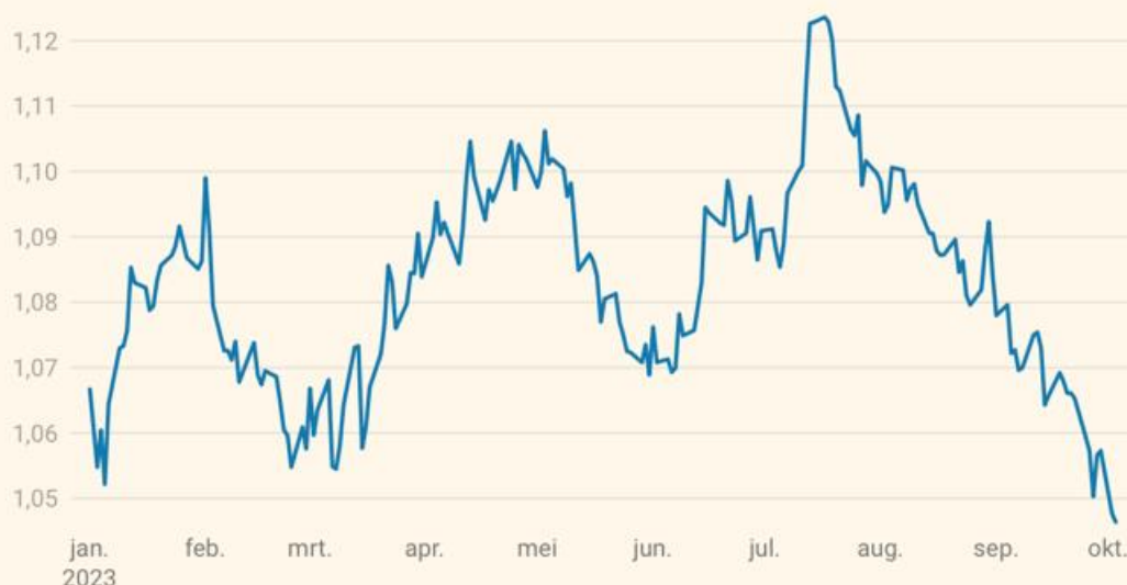
Euro in Amerikaanse dollar

Mocht de voorzitter van de centrale bank (Fed), Jerome Powell, beginnen twifelen aan het belang de missie om de inflatie onder controle te krijgen dan kreeg hij maandag nog een niet zo vriendelijke herinnering. Dit gebeurde op bezoek bij kleine ondernemers in het stadje York in de staat Pennsylvania.