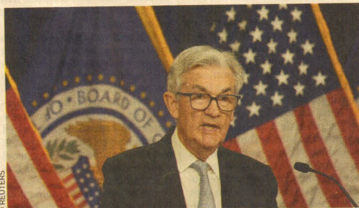
Jerome Powell, de voorzitter van de Amerikaanse centrale bank.

De Europese Centrale Bank en de Bank of England vergaderen vandaag. Economen verwachten dat beide centrale banken hun beleidsrente met 50 basispunten verhogen naar respectievelijk 2 en 3,5 procent.