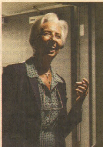
Christine Lagarde.

'Het lijkt erop dat de ECB duiven op het kerstmenu heeft staan', reageerde ING-econoom Carsten Brzeski in een verwijzing naar de strenge toon ('duiven' staan voor een soepel beleid). 'Terwijl andere grote centrale banken zich beginnen voor te bereiden op het einde van hun renteverhogingen, geeft de ECB de indruk nog maar te beginnen.' Hij verwacht dat de ECB-beleidsrente tot 3,5 procent kan klimmen tegen eind volgend jaar. In het eerste kwartaal van 2023 gaat de rente volgens hem al met 1 procentpunt de hoogte in.