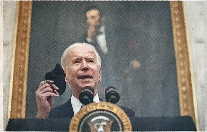
President Joe Biden roept de Amerikanen op een mondkemper te dragen.

Economen verwachten dat de Amerikaanse economie in 2021 met ruim 4 procent groeit. Daardoor zal de activiteit in de tweede helft van dit jaar weer het niveau van net voor de crisis bereiken. Knightley is nog iets positiever. '5 procent groei is mogelijk.'