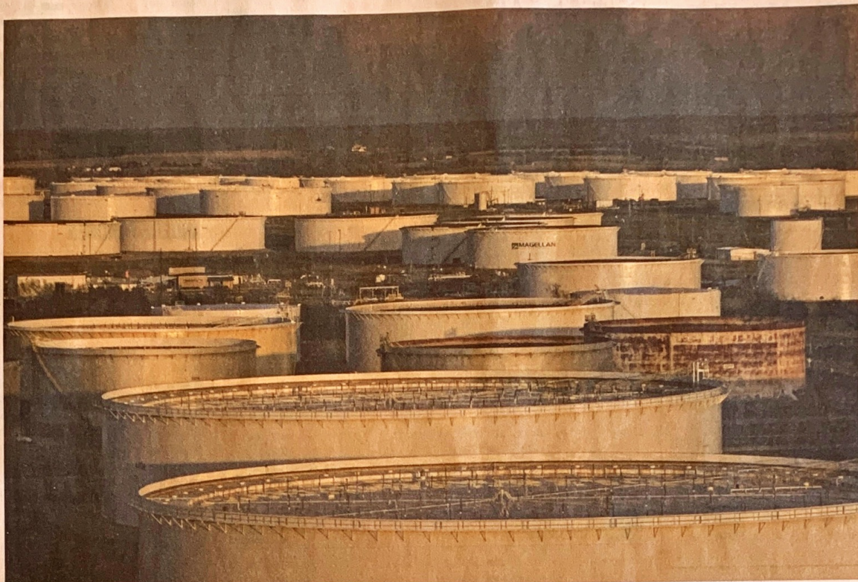
Opslagtanks van olie in de Amerikaanse stad Cushing. Door het overaanbod lopen de tanks vol.

De oliemarkt verwacht dat het overaanbod op de Amerikaanse markt in de komende weken vermindert. De prijs van het junicontract, dat meer wordt verhandeld en vol-